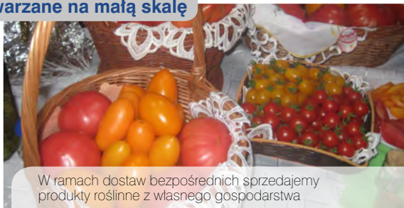
W ramach dostaw bezpośrednich sprzedajemy produkty roślinne z własnego gospodarstwa

Działalność w ramach dostaw bezpośrednich może być prowadzona na terenie województwa, w którym prowadzona jest produkcja pierwotna lub na terenie województw przyległych.