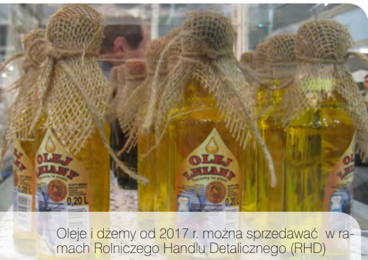
Oleje i dżemy od 2017 r. można sprzedawać w ramach Rolniczego Handlu Detalicznego (RHD)