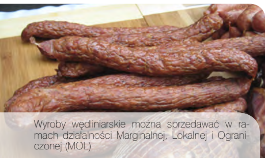
Wyroby wędliniarskie można sprzedawać w ramach działalności Marginalnej, Lokalnej i Ograniczonej (MOL)

Zakład rejestrowany/zatwierdzony – np. rzeźnia, zakład rozbioru mięsa, zakład produkcji mięsa mielonego lub surowych wyrobów mięsnych, zakład przetwórstwa mięsa, zakład przetwórstwa mleka, zakład przetwórstwa ryb.