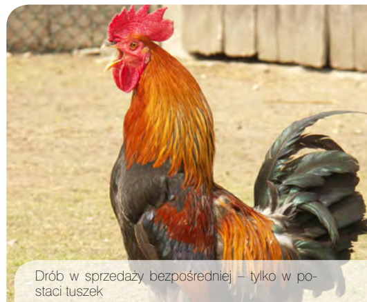
Drób w sprzedaży bezpośredniej – tylko w postaci tuszek