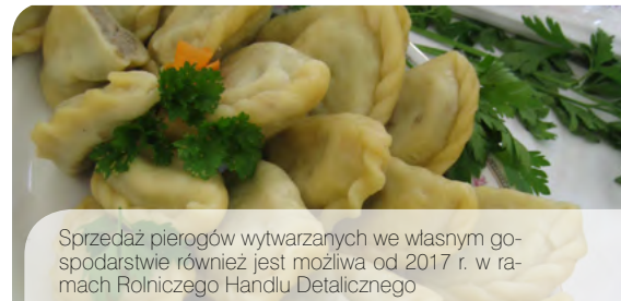
Sprzedż pierogów wytwarzanych we własnym gospodarstwie również jest możliwa od 2017 r. w ramach Rolniczego Handlu Detalicznego