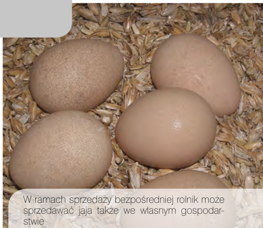
W ramach sprzedaży bezpośredniej rolnik może sprzedawać jaja także we własnym gospodarstwie

Sprzedaż bezpośrednia – sprzedaż do konsumenta końcowego lub lokalnego zakładu detalicznego zaopatrującego konsumenta końcowego surowców pochodzących z produkcji podstawowej, tuszek drobiowych, za-