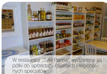
W restauracji „Syta Panna” wydzielone są półki do sprzedaży lokalnych i regionalnych specjalów

Z małego lokalu z domową kuchnią powstała popularna restauracja w Łomży. Potem pojawił się sklep z żywnością regionalną. A niedawno dołączyła rodzinna wytwórnia, w której powstają gotowe dania garmazeryjne i produkty z ryb, bo „Syta Panna” jest firmą rodzinną, specjalizującą się w produkcji unikalnych wyrobów z ryb, takich jak paszety z ryb, ryby faszerowane, ryby marynowane, czy galarety z ryb, wykorzystując wielopokoleniowe przepisy.