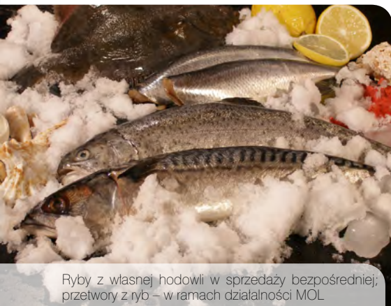
Ryby z własnej hodowli w sprzedaży bezpośredniej; przetwory z ryb – w ramach działalności MOL

Działalność marginalna, lokalna i ograniczona – produkcja i sprzedaż żywności konsumentom końcowym, dostawy żywności do