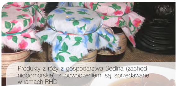
Produkty z róży z gospodarstwa Sedina (zachodniopomorskie) z powódzeniem są sprzedawane w ramach RHD

Zakłady zatwierdzone – przetwórstwo produktów pochodzenia roślinnego. Zatwierdza Państwowy Powiatowy Inspektor Sanitarny.